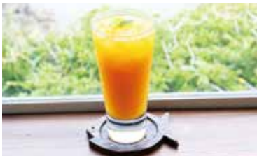
シーサイドカフェ海遊